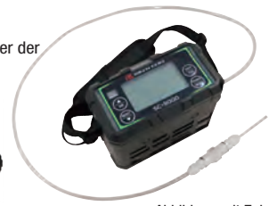
Abbildung mit Zubehör